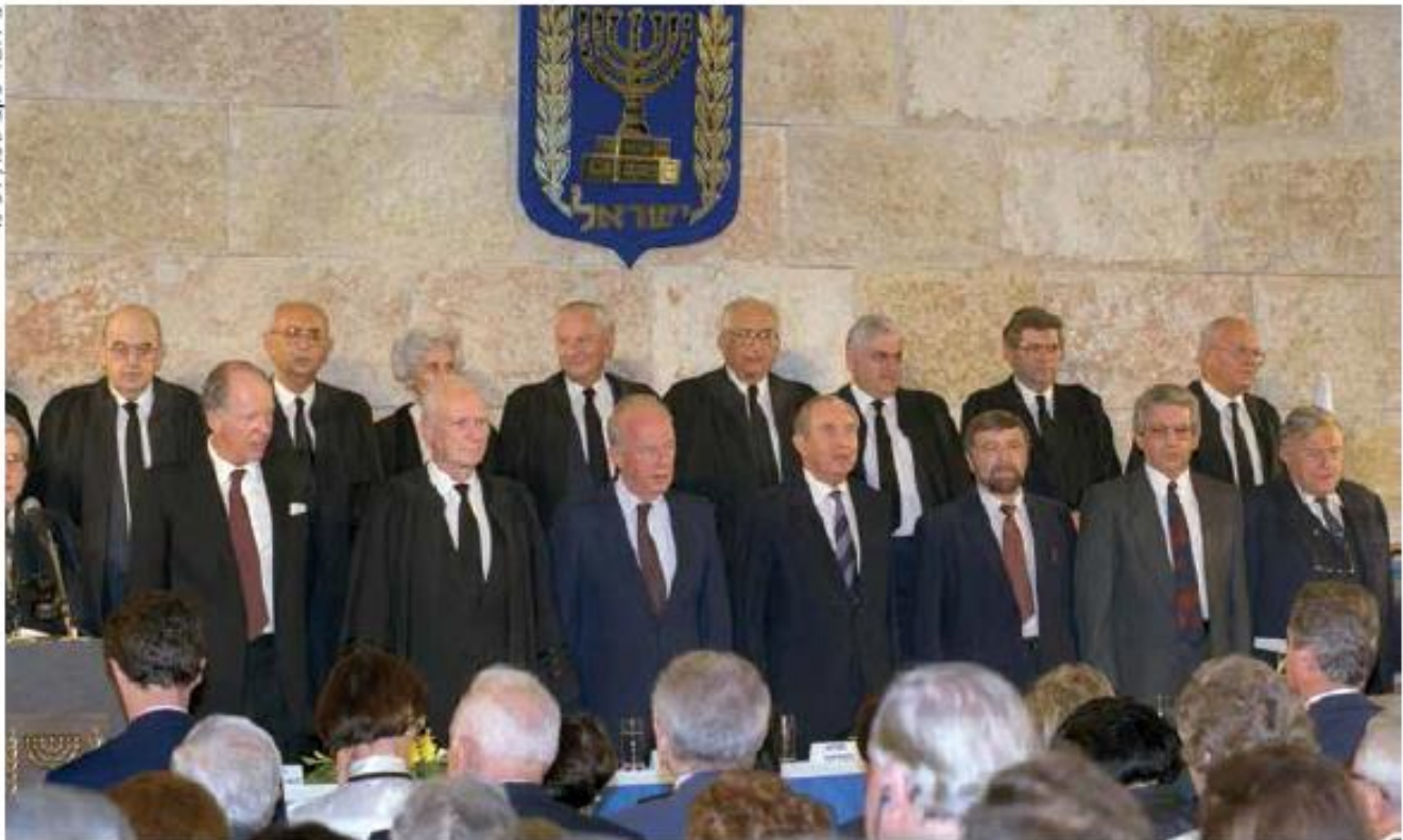
שותף פעיל בבניית משכן הקבע. הנשיא שמגר עם ראש הממשלה רבין ועם הנשיא הרצוג בטקס חנוכת בית המשפט העליון, 1992