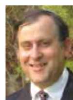
פרופ' אביעד הכהן, דיקן ביה"ס למשפטים והמרכז האקדמי שערי משפט

את מקום הנשמה ידעת? והמצפון, אותו ראית? המי-ששת צדק? ומה ריחה של אמת, טעמו של חסד? שופט לא ידע, לא לבנות בית לא להקים גשר לא לשתול גן פלא. שופט לא לימד עצמו כל אלה. זה דברו של שופט: טובל בקסת עטו וכותב משפט וצדק וחסד. ואלה יהיו עמנו באשר נלך ונבוא, תמיד, בכל יום ובכל עת ובכל שעה.