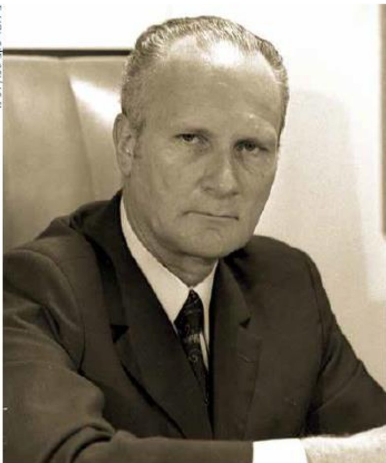
שמגר בכהונתו כשופט בית המשפט העליון, 1976

כיועץ המשפטי לממשלה ביסס את בניין "הנחיות היועץ המשפטי לממשלה" - היכל מפואר של 11 כרכים מלאים וגדושים בהנחיות בכל תחומי המשפט החוקתי והמינהלי